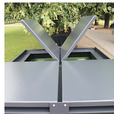
4 låger giver adgang til 660 liters container