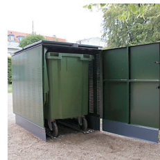
Containeren køres ind fra gavlen, hvorefter lågen lukkes og låses