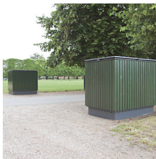
Forskellige beklædningsmuligheder. Her listetræ malet i "parkgrøn"