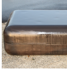
Som standard i grå beton. Optionelt i f.eks. hvid eller antracit.