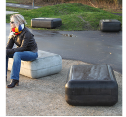
Eksklusive plinte i fiberbeton med silkeblød overflade