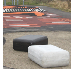
Farvekombinationer skaber spændende udtryk