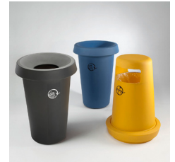
Giro i to versioner: 1) åben top eller (165 l) 2) med to sideåbninger (120 l).