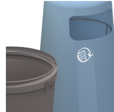
Posen er fastgjort på integreret stålring. Piktogram og farvekode indikerer affaldstype.