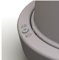
Flexys Giro leveres optionelt med sikkerhedslås.