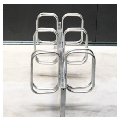
Frame dobbelsidet cykelstativer.