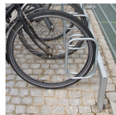
Frame cykelstativ nedstøbt under belægning.