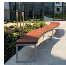
Udtrykket gør det muligt at integrere bænken i byrum.