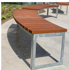
Ara bæk integreret i grønt byrum.