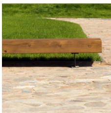
Stop plinten integreret i grønt byrum.