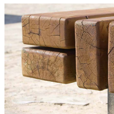
Stop Plinten er her beklædt med tropisk træ på sædet.