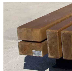
Udtrykket gør det muligt at integrere plinten i byrum.