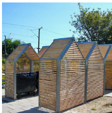
Screen overdækning kan anvendes til miljøstation.