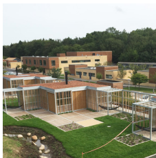
Sensing overdækning kan have sedumtag som option,