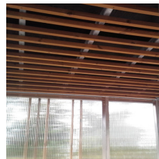
Sensing overdæknings tagkonstruktion indenfor.