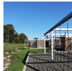
Sensing anvendt til at give samme udtryk til fysisk aktiviteter.