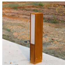
Madinat lyser i to retninger, idet lampen har to lodrette felter.