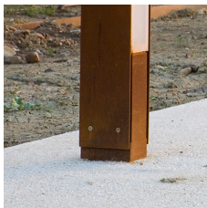
Madinat pullert tilbydes som standard i cortenstål.