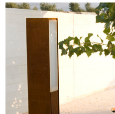
Flexys Madinat udstråler elegance og æstetik.